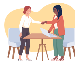
Incubation dans Déclics Jeunes