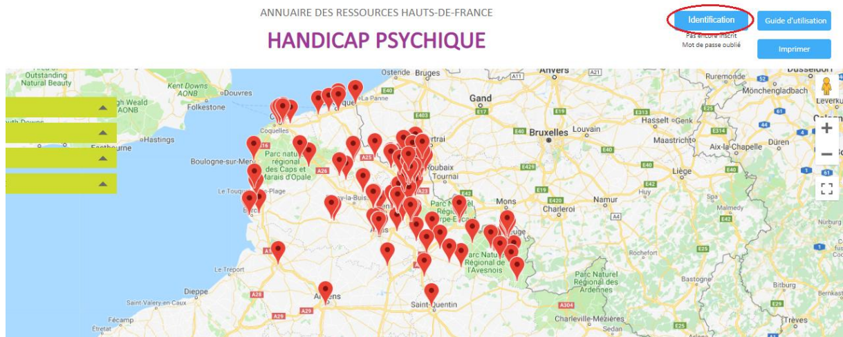
Page d'accueil de l'annuaire

LE CREHPSY | RESSOURCES ET OUTILS | ACTIONS ET ÉVÉNEMENTS | HANDICAP PSYCHIQUE | A LA UNE | E-LEARNING