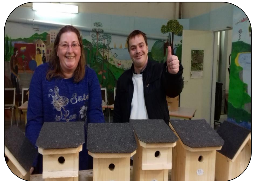
Construction de nichoirs