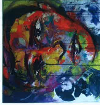
KRLITO Tristesse 2014